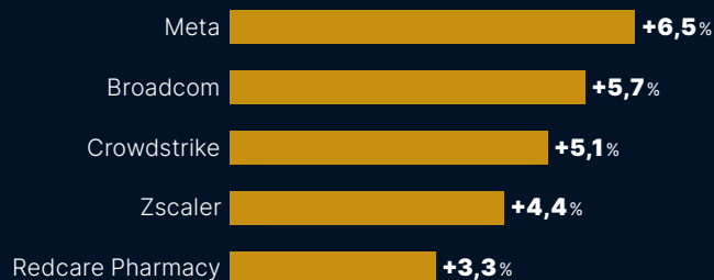
Performance in Prozent