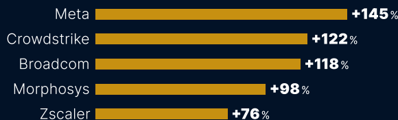
Performance in Prozent