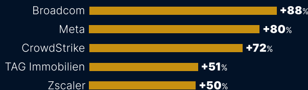
Performance in Prozent