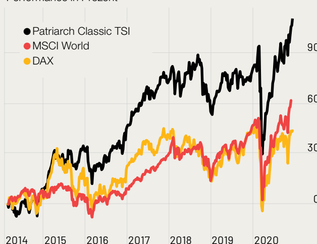
Performance in Prozent

dazu besondere Konditionen an. Denn hier gibt es einen 100-prozentigen Rabatt auf die Transaktionskosten.