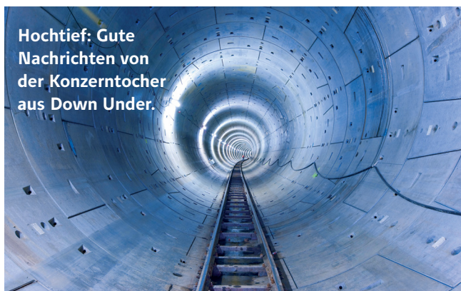
Hochtief: Gute Nachrichten von der Konzerntochter aus Down Under.

Die Zahlen von Cimic haben die Vorjahreswerte übertroffen. Unter dem Strich legte der Gewinn im ersten Halbjahr um zwölf Prozent auf umgerechnet 363 Australische Dollar zu. Der Umsatz kletterte um elf Prozent auf 6,9 Milliarden Australische Dollar. Neben der guten Auftragslage sorgten auch Kosteneinsparungen für das bessere Ergebnis. Daran sollen auch die Aktionäre beteiligt werden. Die Dividende wird für die ersten sechs Monate des Geschäftsjahres um 17 Prozent auf 70 Cent je Aktie angehoben. Hauptprofiteur hiervon ist wiederum Mehrheitseigner Hochtief. Der MDAX-Konzern selbst glänzt mit einer Dividendenrendite von rund 2,5 Prozent. Bei einer Ausschüttungsquote von 51 Prozent ist noch Luft für Dividendensteigerungen.